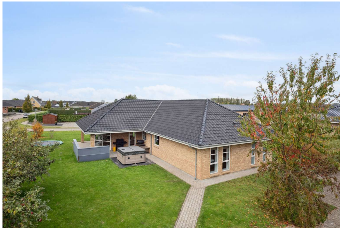
Ejendommen, dejlig nem og børnevenlig have