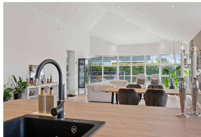
Kig fra køkken til stue